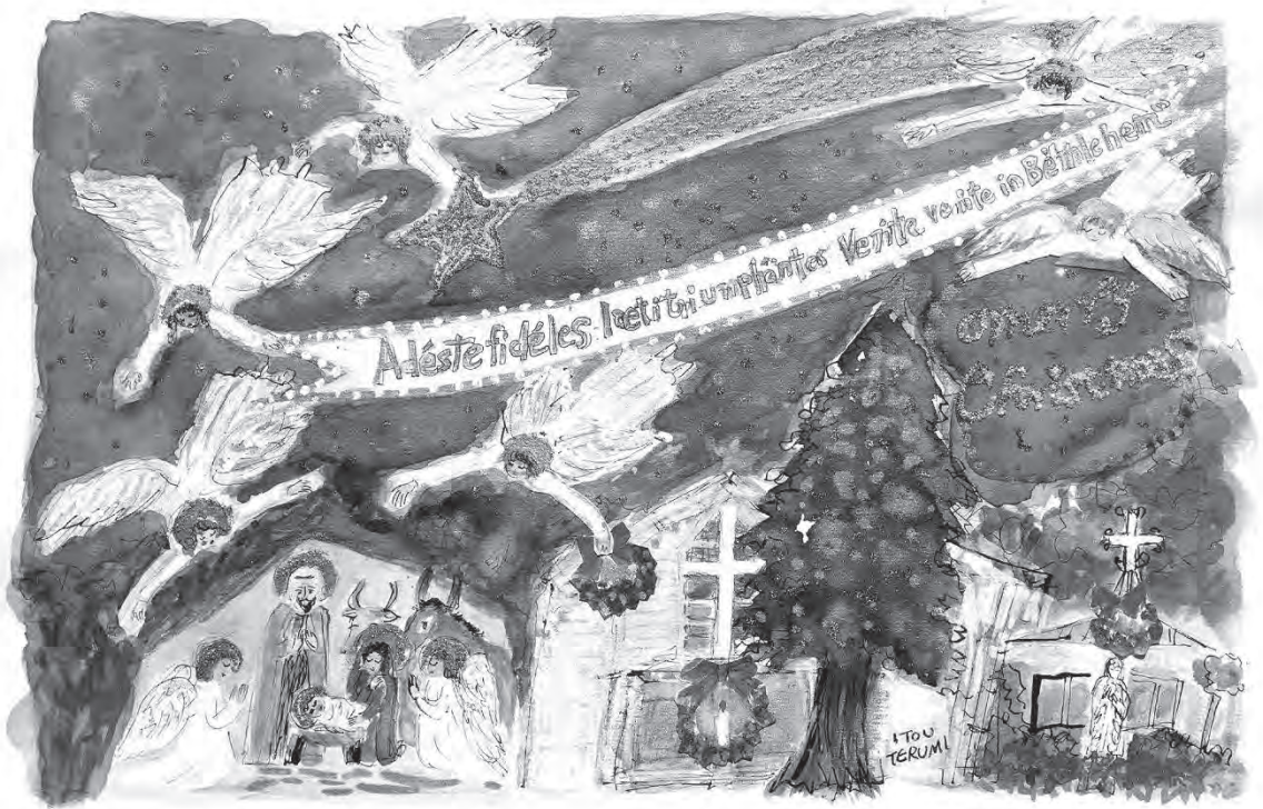
『吉祥寺教会と聖家族』 画・伊藤 輝巳