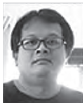
ラディティア神父