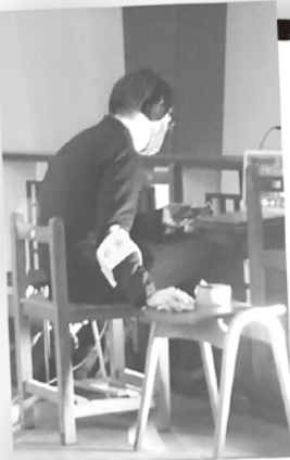
聖堂の2階からの撮影。ライブ配信は真剣勝負。かっこいいぞ!

今後は、コロナの影響で教会に来られない方々のための配信を引き続き継続しながら、徐々に動画撮影の幅を広げ、視聴者の心の支えになるようなチャンネルを目指していきます。