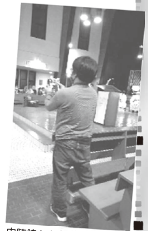
内陣脇から祭壇を撮るカメラも気を抜けません。これからもヨロシクです!