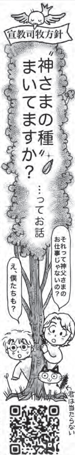
動画はこのQRコードから

昨年12月末、東京大司教区より『宣教司牧方針』が発表されました。これは、今後教区に進むべき大枠を定めたもので、10年を目途に取り組みを行い、振り返りをする事になっています。