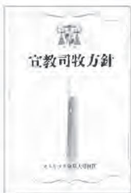
大司教区のホームページには英語版もあります

★『宣教司牧方針』が発表されるまで2018年の聖霊降臨の日に、菊地大司教は『多様性における一致を掲げて』という文書を発表し、宣教司牧方針を作る宣言されました。そして教皇ベネディクト16世の、教会の本質を表す3つの務め、